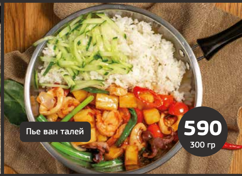
Пье ван талей