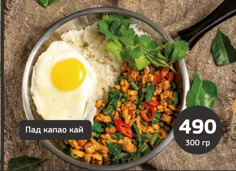
Пад капао кай